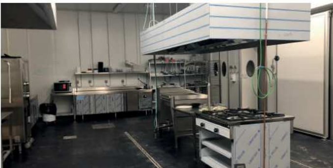
Instalaciones de cocinas industriales

A lo largo de la historia de 4Plus, nunca nos hemos encontrado con un encargo en el que el hecho de disponer de un equipo multidisciplinar no haya supuesto una ventaja. El poder contar con diferentes enfoques capaces de compartir métodos, estrategias, procedimientos y técnicas, convierte los procesos en más enriquecedores, tanto para los integrantes del equipo como para el propio proyecto.