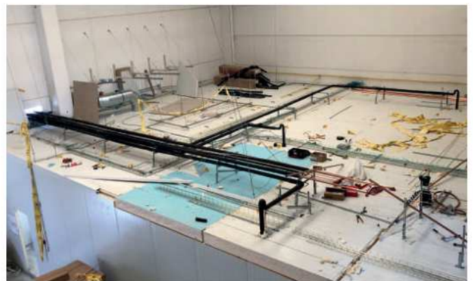
Construcción de una nave de alimentos de quinta gama

La multidisciplinariedad de un equipo técnico permite abarcar sin duda un mayor número de proyectos, por poder incluir aquellos más ambiciosos y exigentes.