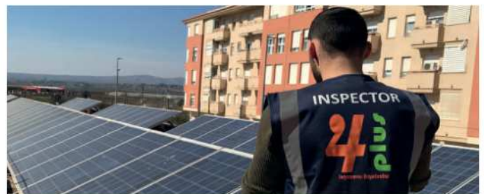
Imagen 1. Dirección de la instalación por ingeniero de 4Plus

Desde 4Plus , como empresa especializada en el sector, venimos observando que cada vez más, son mejores las prestaciones de los elementos, y sin embargo, sus precios son menores. Sin ir más lejos, ya se ofertan paneles con potencias de 400W, más baratos que paneles que se ofertaban hace unos años con la mitad de potencia . Referente a las Ayudas, tanto Entidades regionales como gobiernos están apostando por las Energías Renovables cada vez con más fuerza.