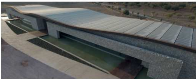
Exterior de bodega Son Mayol – Palma de Mallorca

Para 4Plus, el hecho de contar con un equipo multidisciplinar formado por ingenieros agrónomos, ingenieros de telecomunicaciones, ingenieros industriales, ingenieros de caminos, arquitectos, etc., con una continua interacción y comunicación, compartiendo una visión común, supone posiblemente una de sus mayores ventajas.